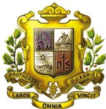
ตรามูลนิธิคณะเซนต์คาเบรียลแห่งประเทศไทย

โรงเรียนนี้มีชื่อว่า โรงเรียนอัสสัมชัญพาณิชยการ เป็นโรงเรียนในเครือมูลนิธิคณะเซนต์คาเบรียลแห่งประเทศไทย