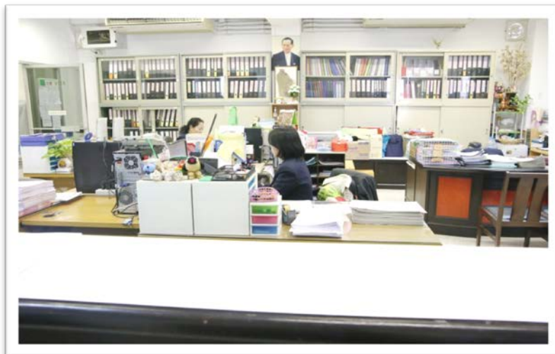
ห้องวิชาการ