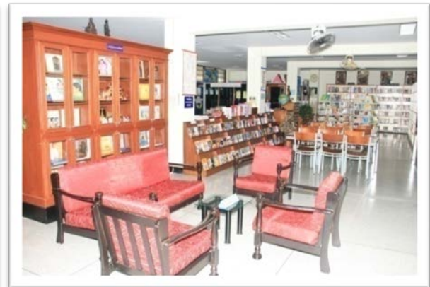
ห้องสมุด

อาคารอัสสัมชัญ (อาคารคอนกรีตเสริมเหล็ก ๔ ชั้น) ประกอบด้วย