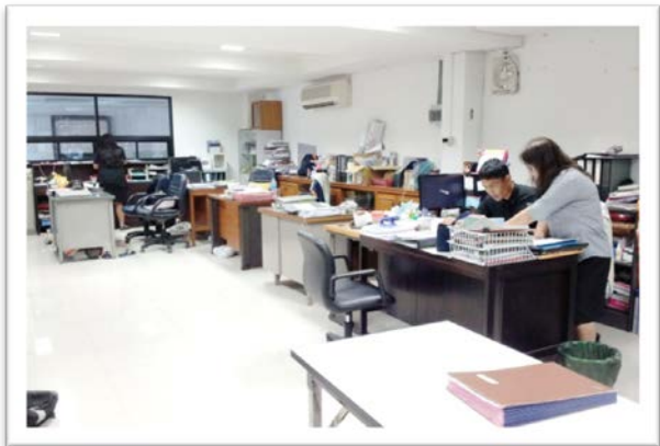
ห้องกิจกรรมนักเรียน

อาคารเฉลิมพระเกียรติ (อาคารคอนกรีตเสริมเหล็ก ๓ ชั้น) ประกอบด้วย