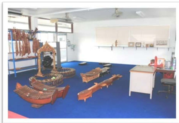
ห้องดนตรีไทย