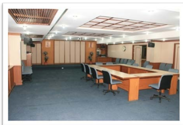
ห้องประชุม/สัมมนา