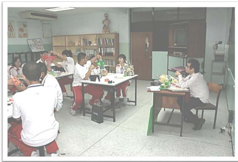
ห้องปฏิบัติการวิทยาศาสตร์