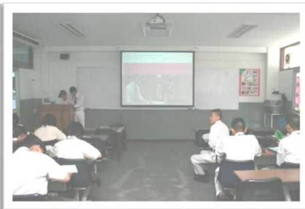
ห้องปฏิบัติการทางภาษา