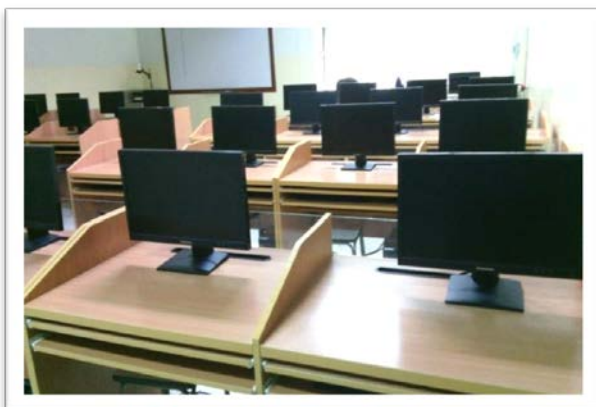
ห้องปฏิบัติการคอมพิวเตอร์ ๑