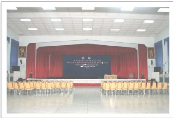
หอประชุม