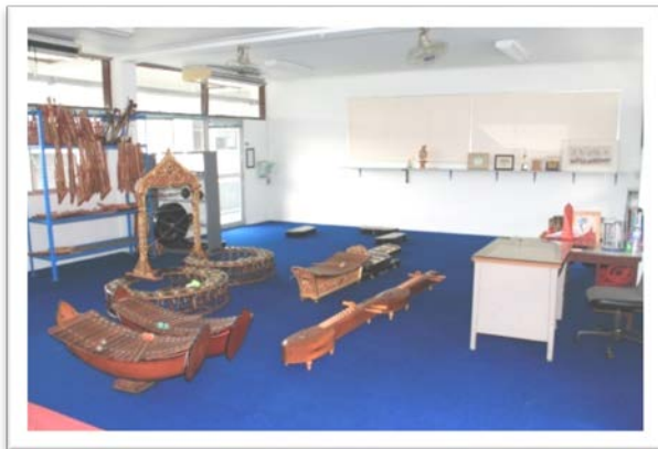
ห้องดนตรีไทย