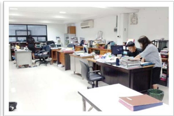
ห้องกิจกรรมนักเรียน

อาคารเฉลิมพระเกียรติ (อาคารคอนกรีตเสริมเหล็ก ๓ ชั้น) ประกอบด้วย