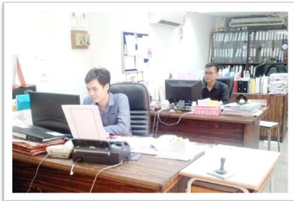
ห้องสมาคมผู้ปกครองและครูฯ (PTA)