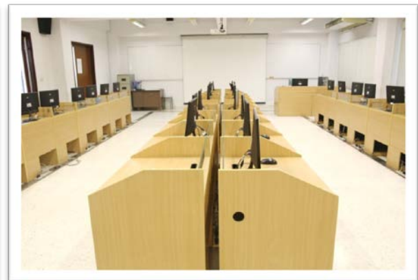
ห้องปฏิบัติการคอมพิวเตอร์ ๒