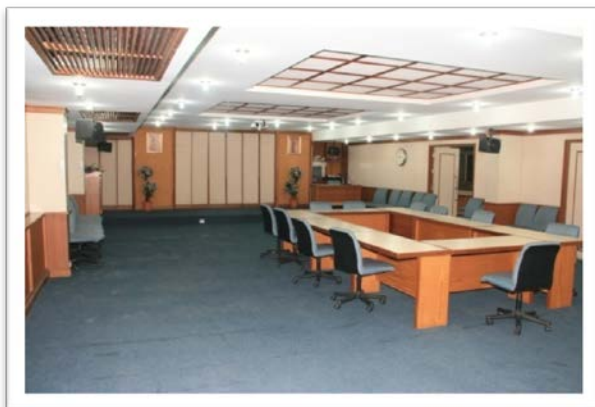
ห้องประชุม/สัมมนา