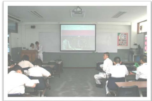
ห้องปฏิบัติการทางภาษา