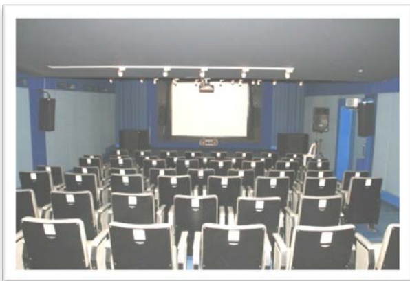
ห้องฉายภาพยนตร์ขนาดเล็ก