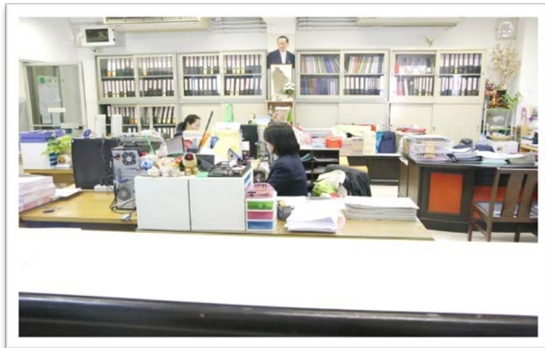
ห้องวิชาการ