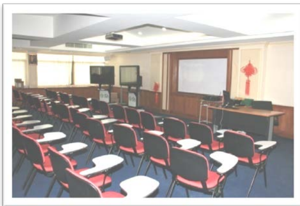
ห้องปฏิบัติการห้องเรียนขงจื้อ