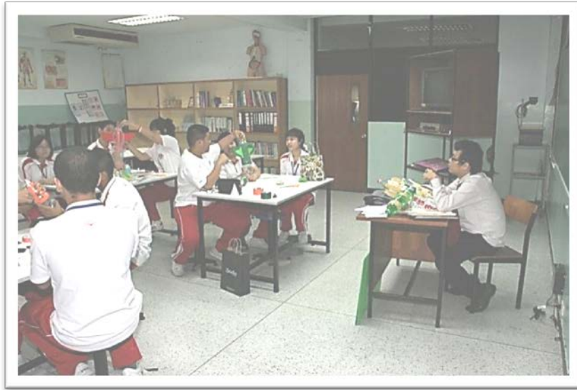
ห้องปฏิบัติการวิทยาศาสตร์

อาคารมงฟอร์ต (อาคารคอนกรีตเสริมเหล็ก ๔ ชั้น) ประกอบด้วย