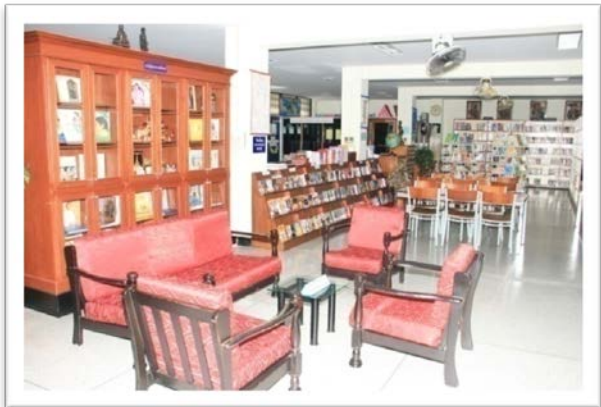
ห้องสมุด

อาคารอัสสัมชัญ (อาคารคอนกรีตเสริมเหล็ก ๔ ชั้น) ประกอบด้วย