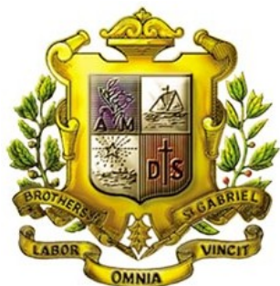
ตรามูลนิธิคณะเซนต์คาเบรียลแห่งประเทศไทย