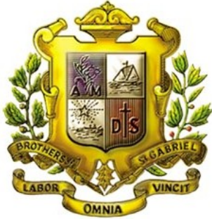
ตรามูลนิธิคณะเซนต์คาเบรียลแห่งประเทศไทย