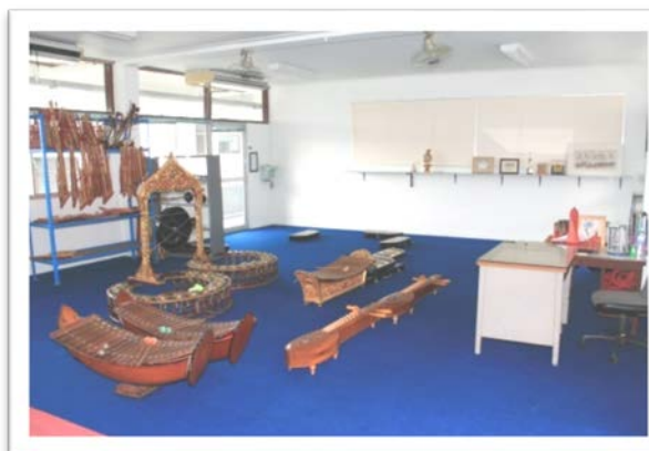
ห้องดนตรีไทย