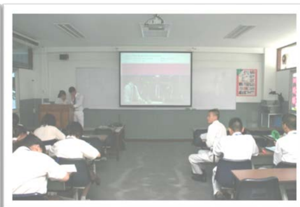
ห้องปฏิบัติการทางภาษา