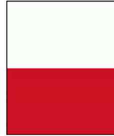
สีประจำโรงเรียน ขาว - แดง

ตราประจำโรงเรียน ประกอบด้วยวงกลมซ้อนกันสองวง วงกลมวงในมีตราสัญลักษณ์ของโรงเรียนในเครือฯ และมีชื่อโรงเรียนเป็นภาษาอังกฤษ “ASSUMPTION COMMERCIAL SCHOOL” อยู่ด้านล่าง ส่วนวงกลมวงนอกมีชื่อโรงเรียนเป็นภาษาไทย “โรงเรียนอัสสัมชัญพาณิชย์การ” อยู่ด้านบน และมีข้อความ “เขตสาทร กรุงเทพมหานคร” อยู่ด้านล่าง ซึ่งตราประจำโรงเรียน แสดงถึง สถาบันการศึกษาที่มีความมั่นคง มีคุณภาพในการให้การศึกษา อบรม กล่อมเกลาเยาวชนทุกคนที่เข้ามาเรียนยังสถาบันแห่งนี้