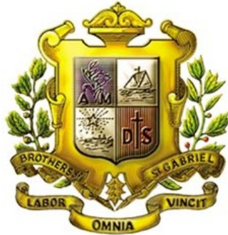
ตรามูลนิธิคณะเซนต์คาเบรียลแห่งประเทศไทย

โรงเรียนนี้มีชื่อว่า โรงเรียนอัสสัมชัญพาณิชย์การ เป็นโรงเรียนในเครือมูลนิธิคณะเซนต์คาเบรียลแห่งประเทศไทย